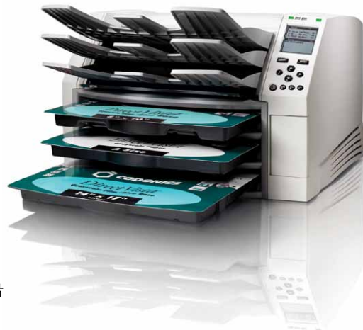
8" x 10", 11" x 14" (可选项), 14" x 17" 蓝基、透明基胶片